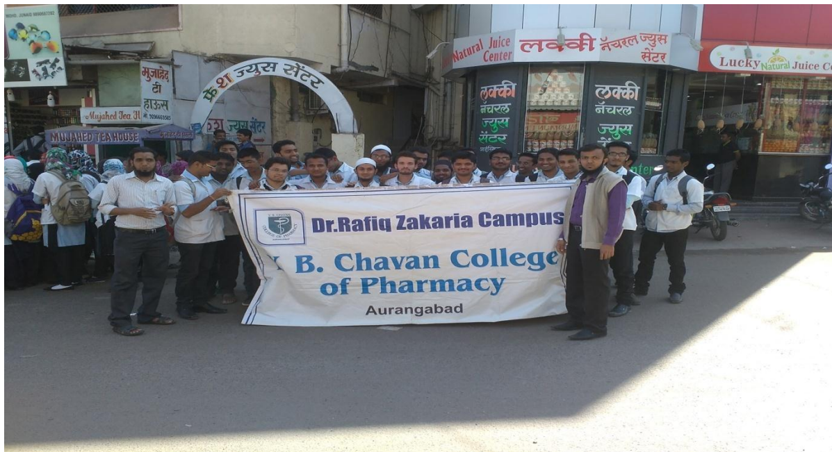
NSS Volunteers in IPA rally at Paithan Gate with Program Officers

NSS volunteers celebrated National Pharmacy Week (NPW) 2016 and participated in a Rally organized by Indian Pharmaceutical Association (IPA) on 27 Jan. 2016 from Paithan Gate to Aushadhi Bhavan Aurangabad.