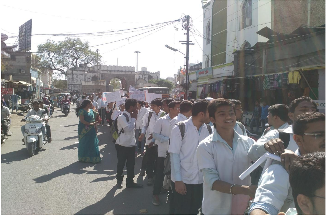
NSS Volunteers in IPA Rally