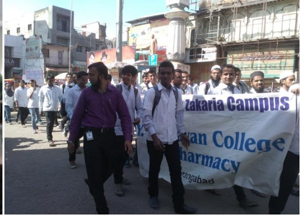
Memories of IPA rally 2015-16