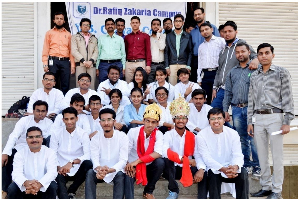
NSS Team of YB for Street Show

The N.S.S. volunteers of Y.B.Chavan College of Pharmacy conducted and participated in “Street show” on 25 Jan. 2016 to educate the people about safety and use of antibiotics at Rauza Bagh corner Aurangabad.