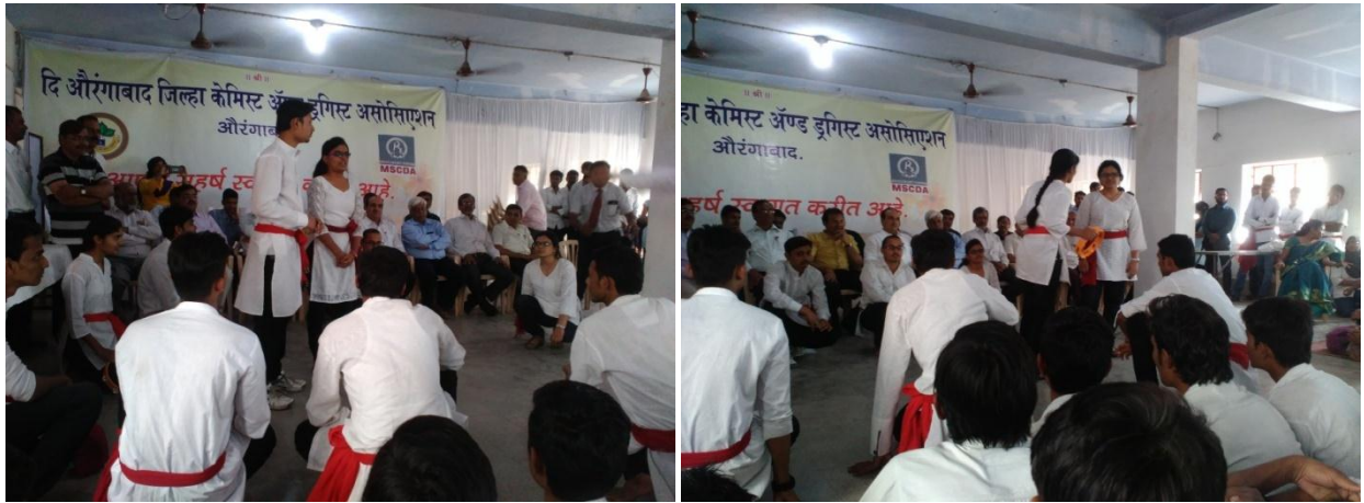
NSS volunteers performing in front of Drug Inspector at Aushadhi Bhavan and got the First Prize