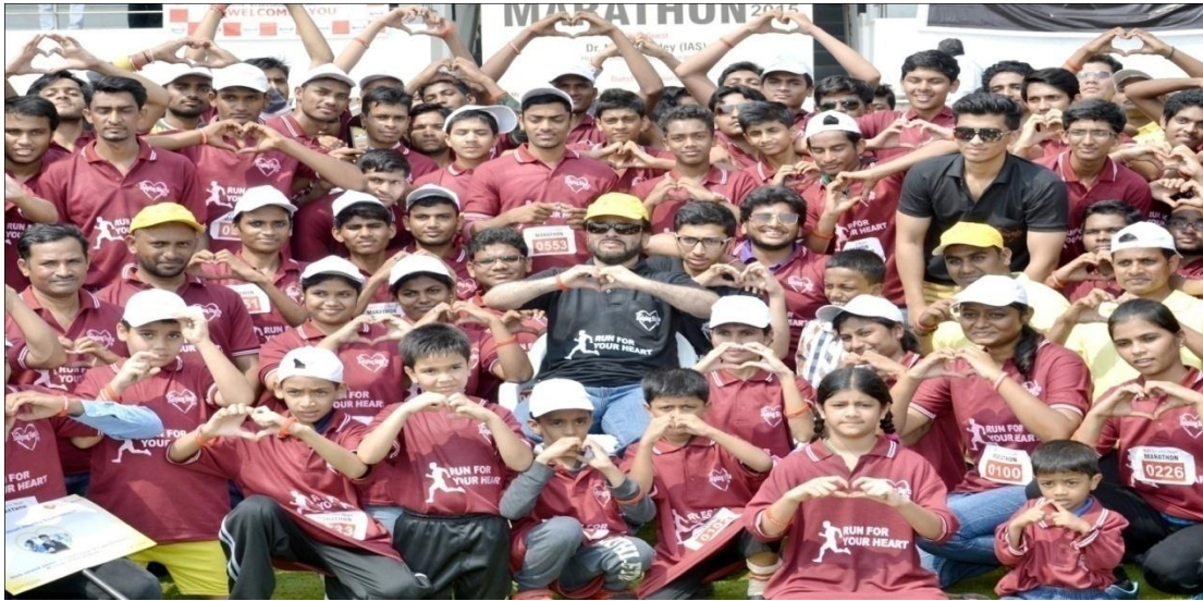
Run For your Heart Marathon-2015 at MGM hospital

The “Run for Heart Marathon” was conducted on 4 Oct. 2015 organized By MGM doctor’s team from MGM hospital to Kranti Chawk, Aurangabad. Around 50 NSS volunteers of college had taken part into the marathon and distributes the posters related to the health issues.