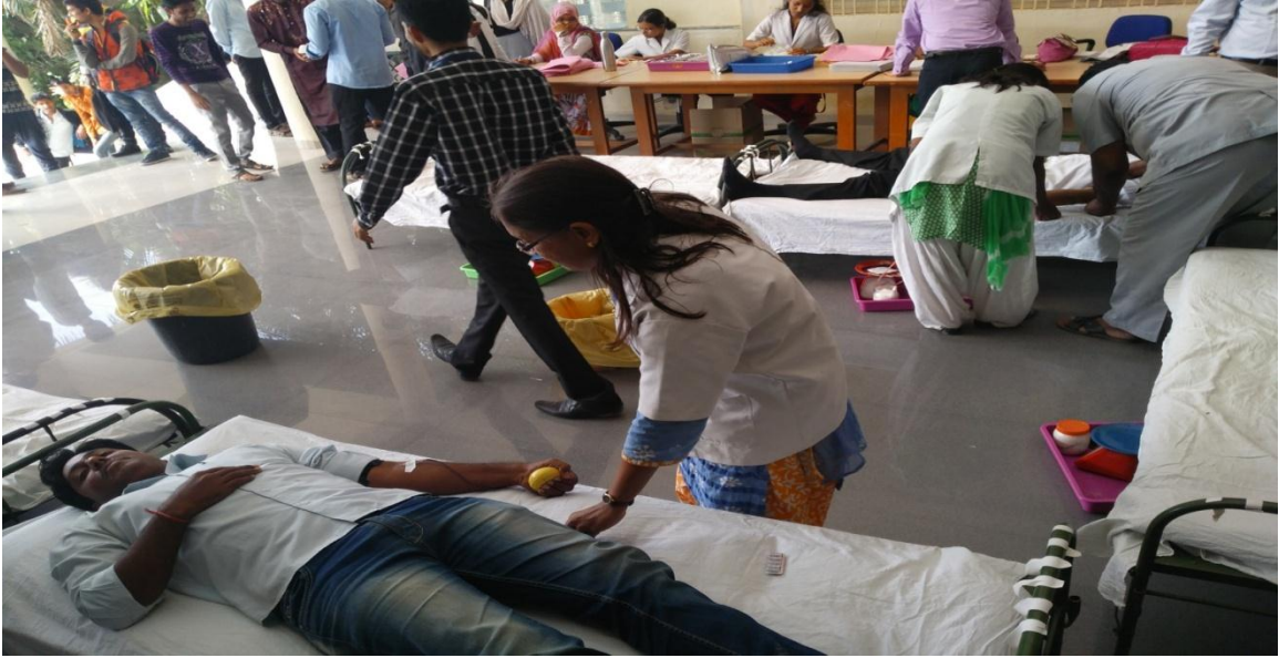
NSS Volunteers donating the blood in the camp