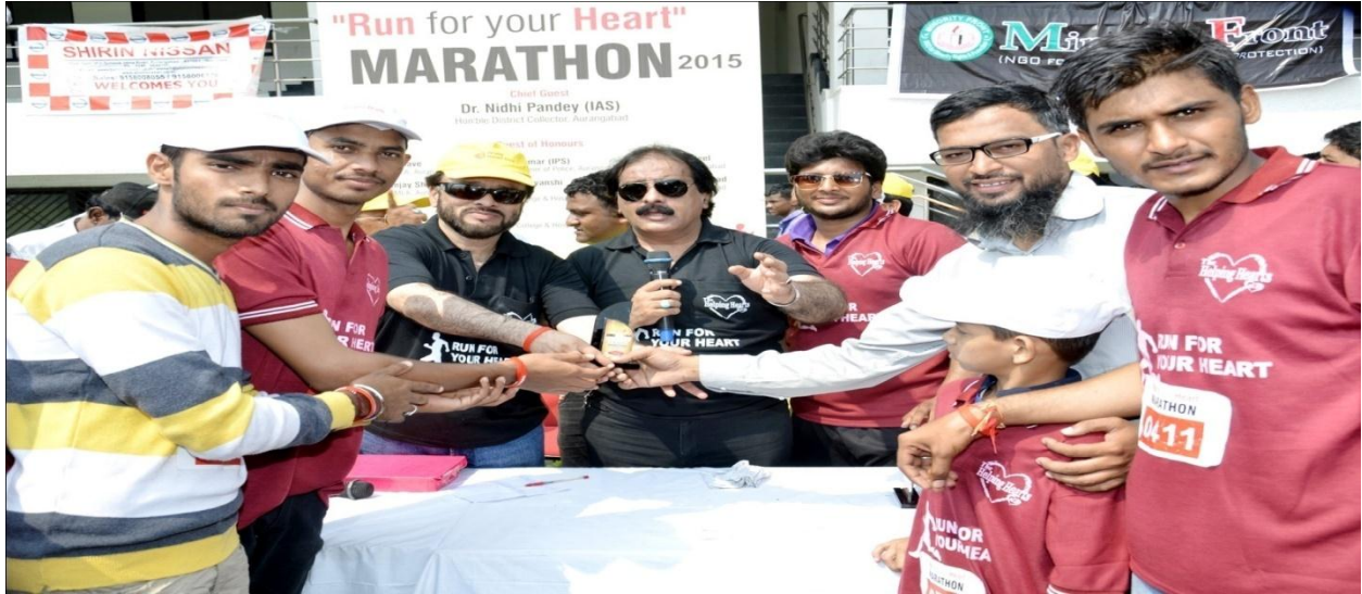
Volunteers receives the participation award in Marathon