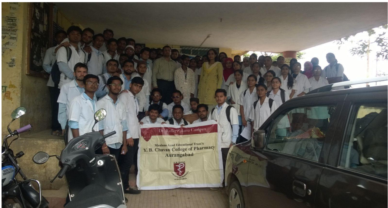
NSS Team for Dengue Cleanliness drive with Aurangabad Municipal Corporation Unit