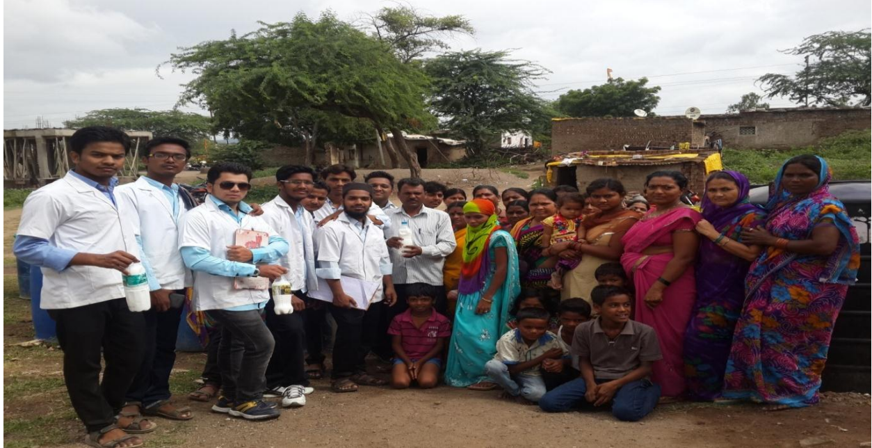
Dengue Cleanliness drive in Aurangabad City