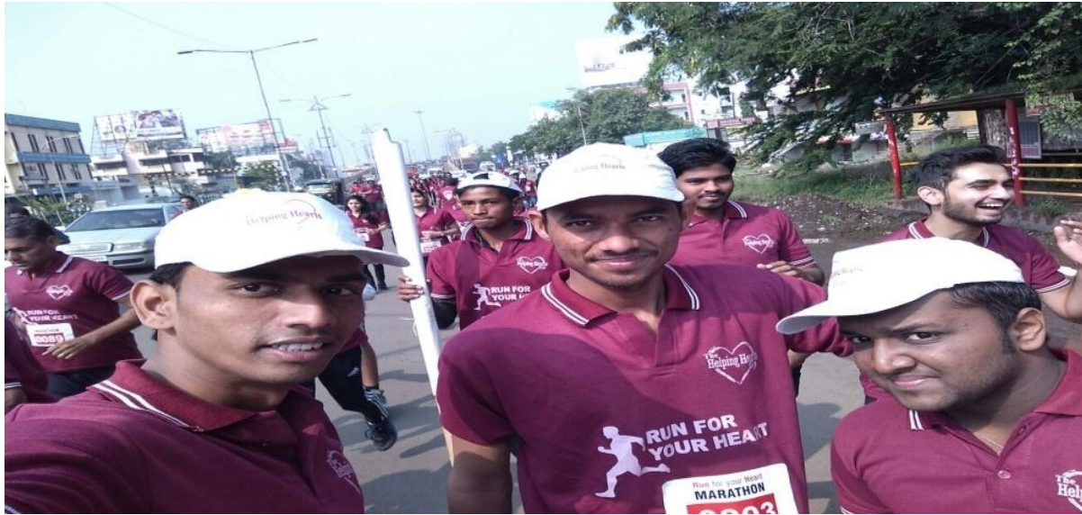
Memories of Run for heart Marathon