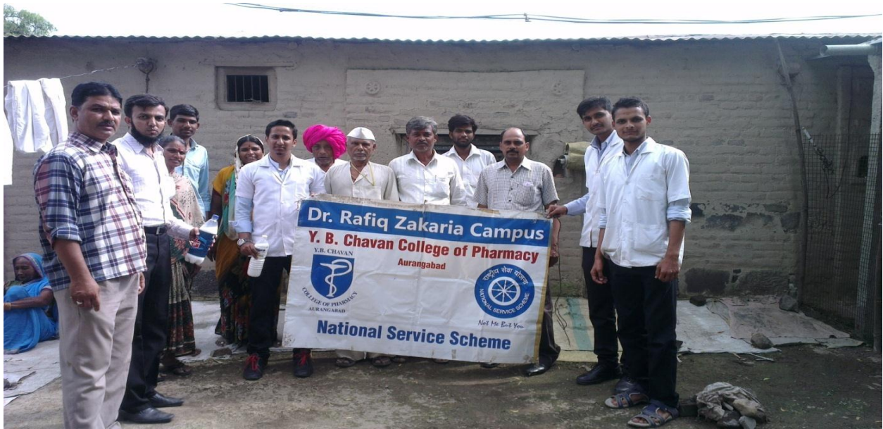
Dengue Cleanliness drive with Aurangabad Municipal Corporation at Fatiabad