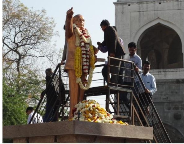
Memories with Vice Chancellor at Samta Rally-2015