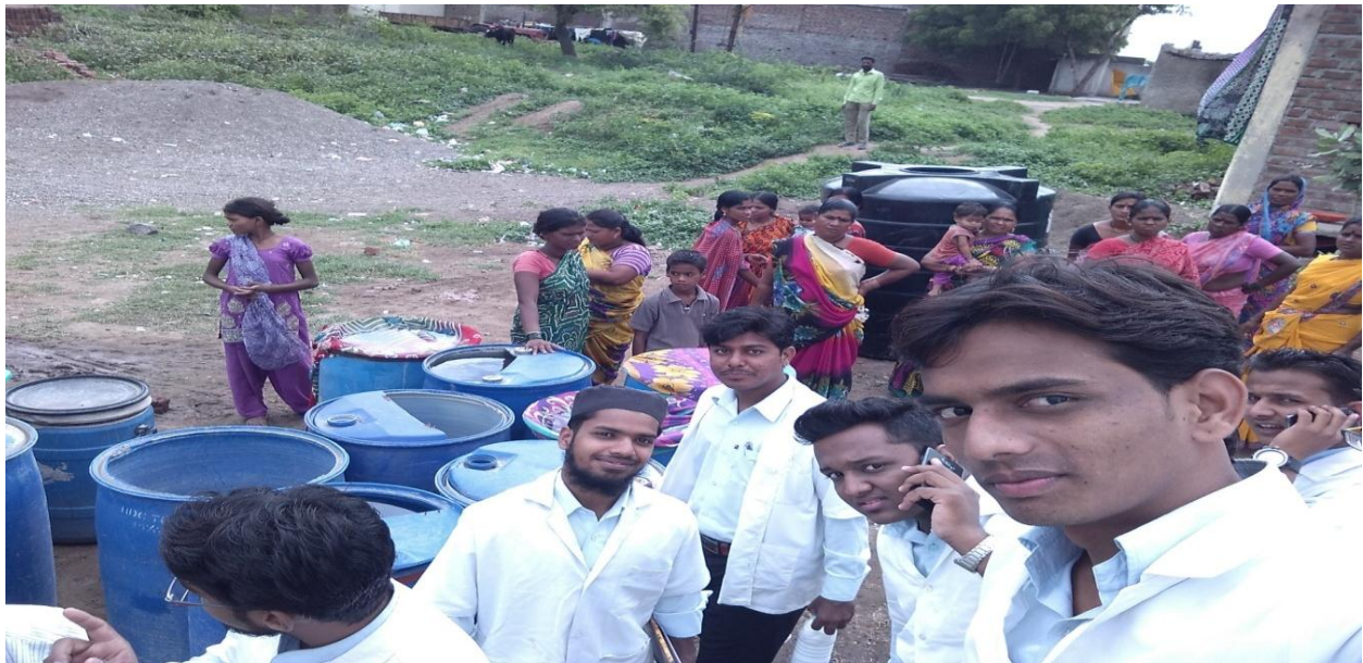
Cleanliness drive at Samarth Nagar, Aktanagar etc of Aurangabad City