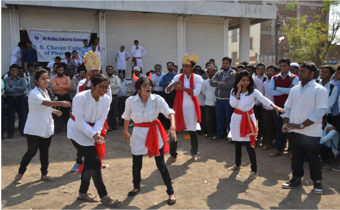
NSS volunteers performing the street Show