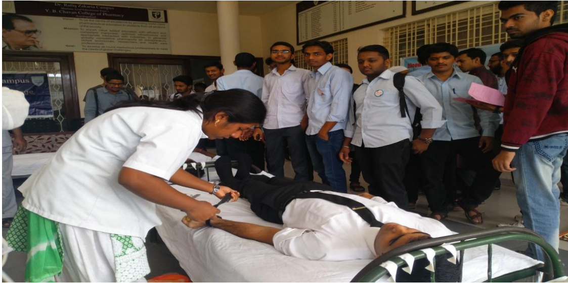
Students from different colleges of campus donating the Blood