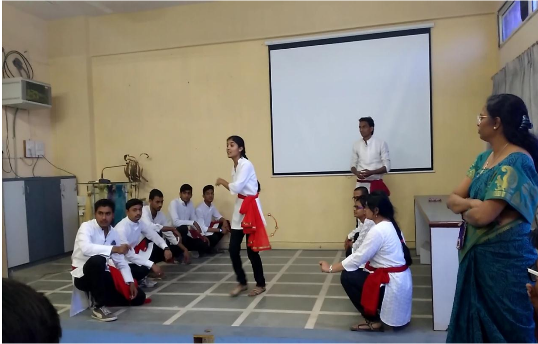
NSS volunteers performing the street Show at Govt. College and wins the first Prize in intercollegiate competition.